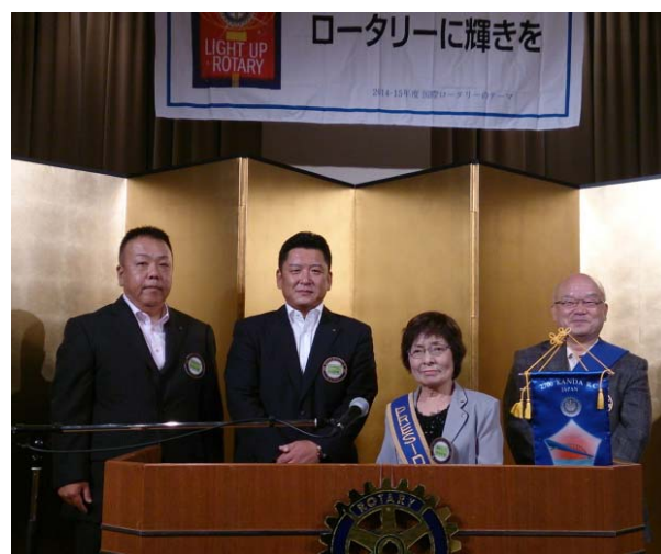
新旧会長幹事 離就任式