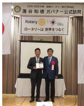
灘谷ガバナーより、個人寄付の米山功労者として屏会員とポールハリスフェロー

より鈴木会員にサファイヤ 4 粒のピンバッジが渡されました。おめでとうございます！