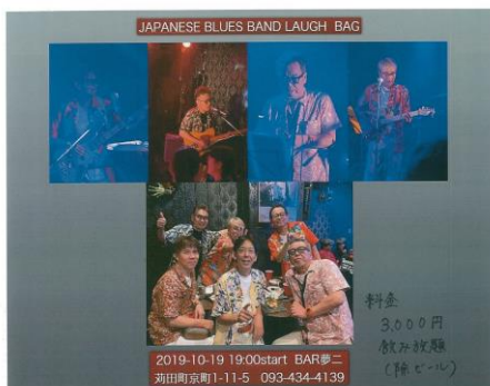
JAPANESE BLUES BAND LAUGH BAG

10月19日 19時~BAR 夢二にて JAPANESE BLUESBAND LAUGH BAG の生ライブ があります。 皆様、 聴きにきま せんか？