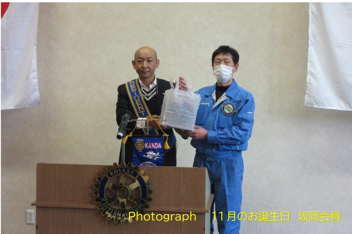
Photograph 11月のお誕生日 坂岡会員