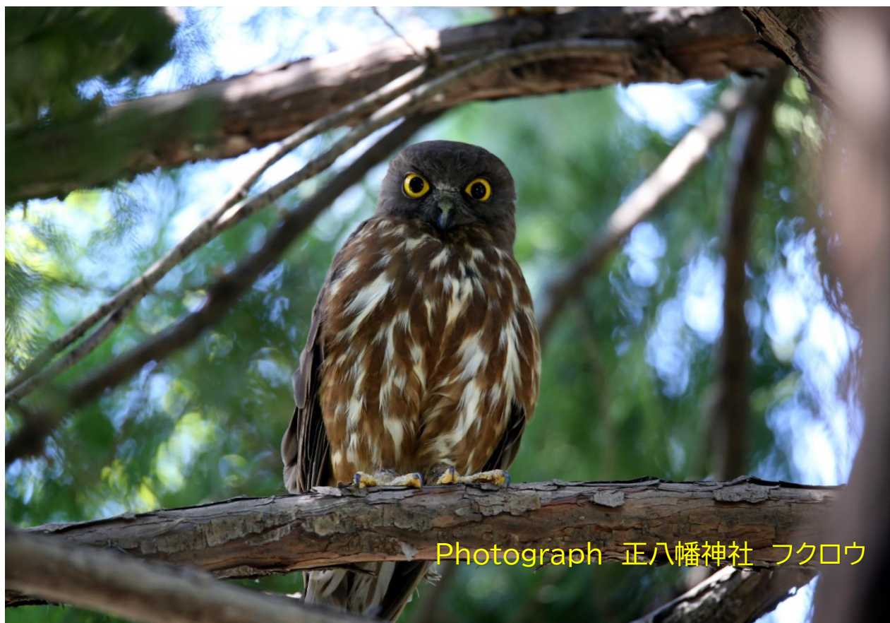
Photograph 正八幡神社 フクロウ