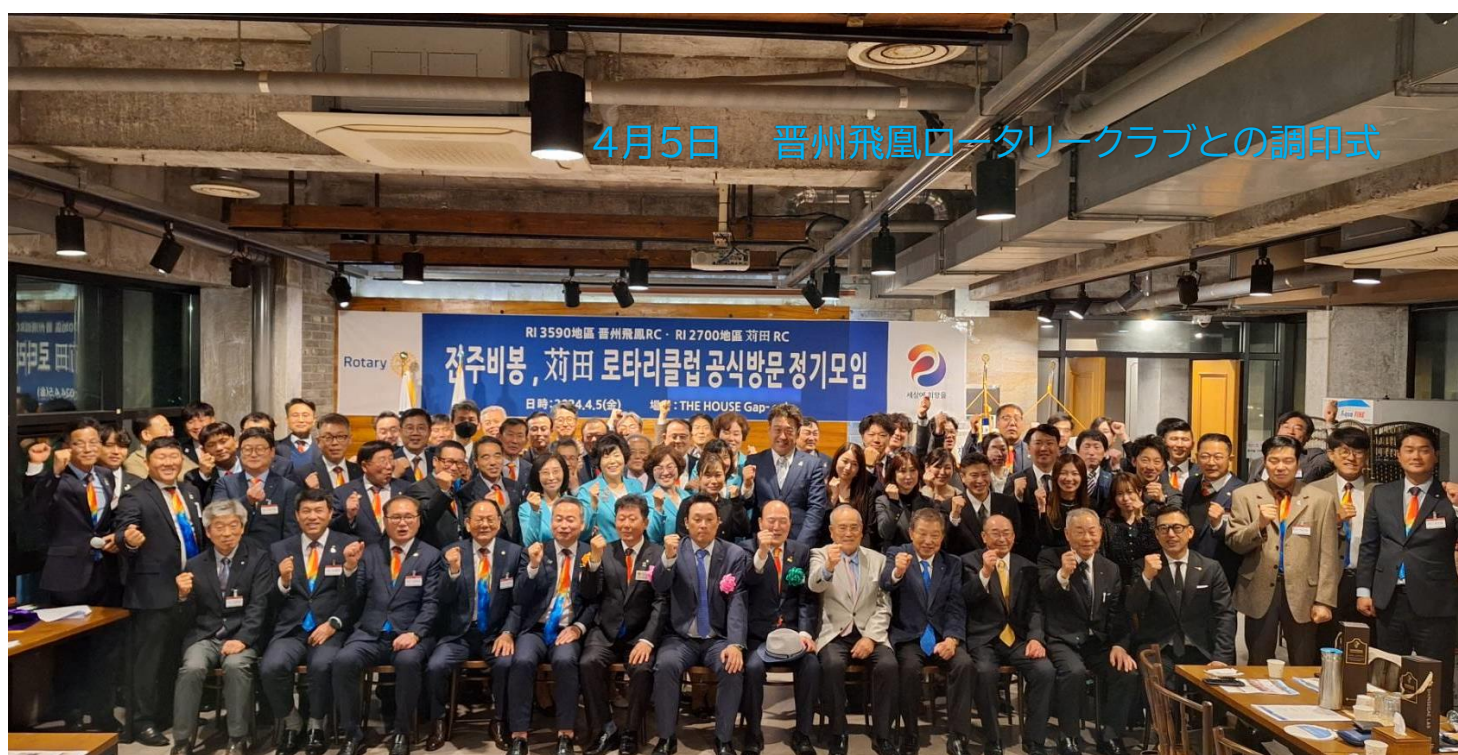
4月5日 晋州飛凰ロータリークラブとの調印式